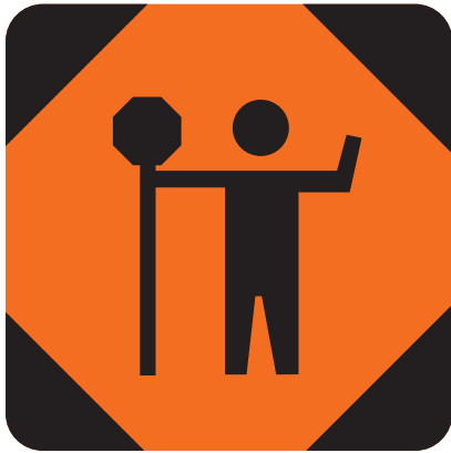
Panneau avancé Brigadier