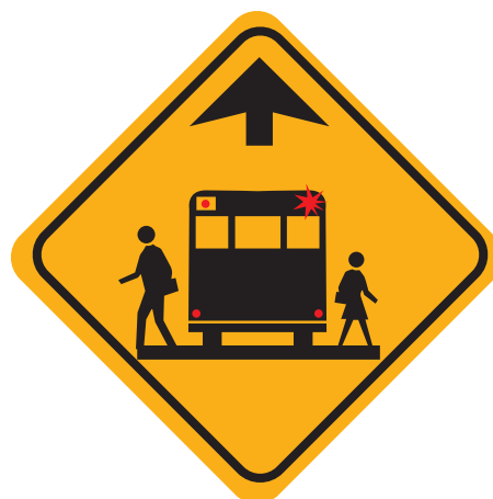
Panneau avancé Arrêt d'autobus scolaire caché