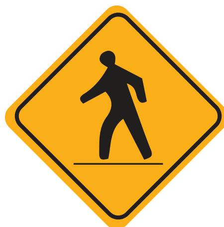
Attention aux piétons