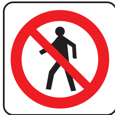
Panneau Interdit aux piétons