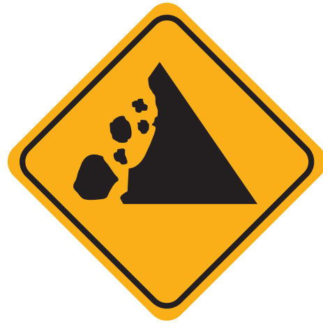
Panneau Gare aux éboulements