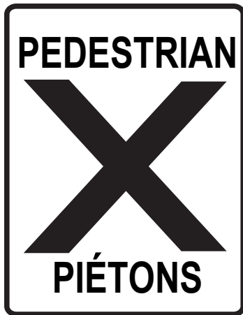
Panneau Passage piétonnier interdit d'ici à la zone de passage piétonnier