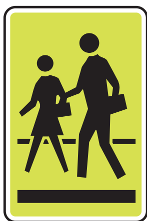
Panneau Passage pour écoliers