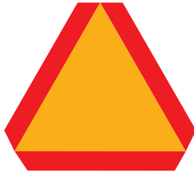
Panneau Véhicule lent