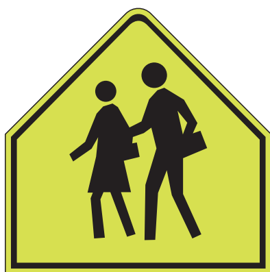
Panneau Zone scolaire