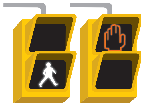
Signaux Traverser / Attendre