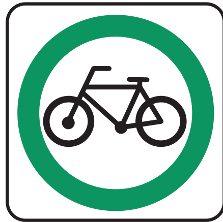
Panneau Vélos autorisés