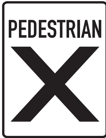
Panneau Passage piétonnier