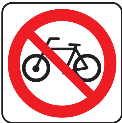
Panneau Vélos interdits